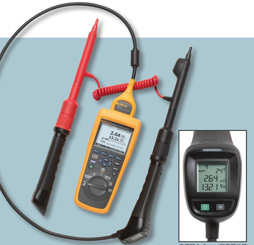
具備整合式 LCD 顯示器的智慧型測試探棒